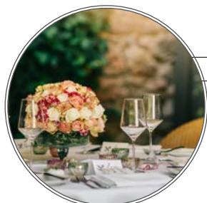
KERT / GARDEN (Total 70)